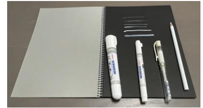
メモ帳と白鉛筆・ペン