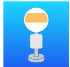
バスあと何分アプリ

アプリは無料で入手できます。利用時の月額料金も無料です。アプリを起動するとバス会社の一覧が表示されます。その中から「関東バス」「都営バス」など利用したいバス会社を選択します。五十音順にバス停の名前が並んでいるので、目的のバス停を選択すると、バスの時刻表が確認できます。