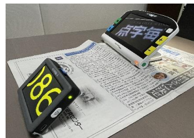
左：クローバー3 右：アミーゴ HD

画面の大きさは3.5インチ、重さが約100グラムと軽量で使いやすい拡大読書器です。対象物から少し距離を離しても鮮明に映るため、商品の値札や食品の賞味期限の確認など様々な用途にお使いいただけます。