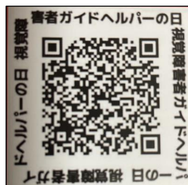
QRコード ガイドヘルパーの日

12月3日に、西早稲田の視覚障害者団体連合で開かれた「視覚障害者ガイドヘルパーの日」設立記念式典に参加してきました。全国で不足しているガイドヘルパーのことがもっと認識されて、この仕事に興味を持ってほしいと願っています。