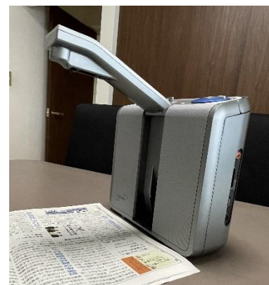
クリアリーダープラス

携帯型のカラー拡大読書器。液晶モニターのサイズは7インチで、拡大倍率は1.4から25倍。文字色がカラー、白黒や白黒反転など32色の表示モードがある。明るさ調節機能やLEDライトオン/オフ機能などもある。35度/90度の2段階に調整できるスタンド付き。HDMI対応モニターやテレビへの映像出力も可能。