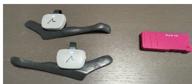
左：アシラセ右：シグナルエイド

視覚障害者の単独歩行を支援するナビゲーションシステムです。スマートフォンアプリによる音声入力や案内および、靴につける振動インターフェースで構成されています。靴に装着し、専用アプリと連動させて使用します。こちらも事前に連絡ください。