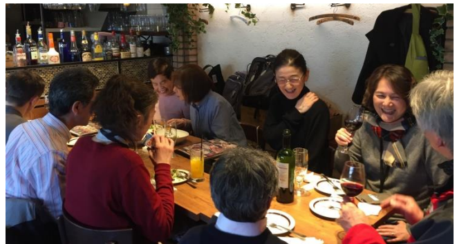
語学習得の場 教室後の飲み会

2月16日は、NHKの取材がありました。飲み会の様子まで収録していただきました。参加者の皆さま、取材協力ありがとうございました。毎回、想定外のことが起こるので、みんなで歌う“une belle histoire”(日本でヒットしたミスターサマータイムの原曲)が進みません。3月は歌も進めたいと思います。勉強の場より、勉強後の飲み会のほうが楽しくなっています。