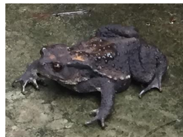
長い冬から目覚めたひきがえる

この通信は、NPO 法人グローイングピープルズウィルを支援してくださっている会員の皆様及び関係者、相談支援事業所・居宅介護支援事業所、同行援護事業所アンサンブルの利用者の皆様に送っています。