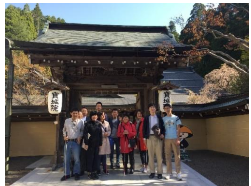
宿坊の前で記念写真(昨年の様子)