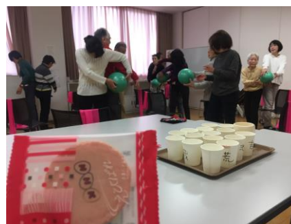
ストレッチを背景に NHK のお菓子

第 1、第 3 火曜日の午前中に、ゆうゆう今川館で開催しました。寒い中、参加してくださっている方々には感謝しています。2 月 5 日（火）は、NHK ラジオの取材が入りました。皆様のおかげで良い収録ができた NHK スタッフも感謝していました。