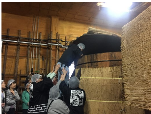
木桶樽によじ登り赤酢の香りを嗅ぐ様子