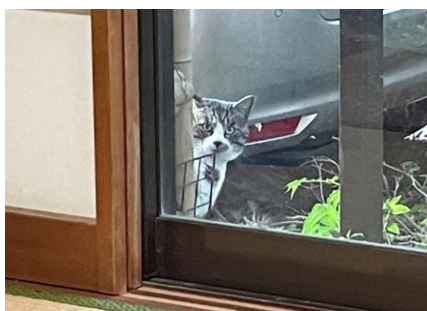
家の中を窺うやくざな猫

季刊 GPW 通信 第 21 号 (2022 年 初春号) 2022 年 1 月 1 日発行