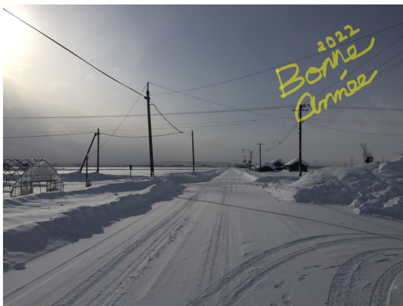
北海道雨竜郡妹背牛町にて