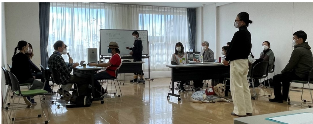
スマホ講習会の様子

コロナ感染予防のため、全てのイベント参加される方に下記のことをお願いいたします。