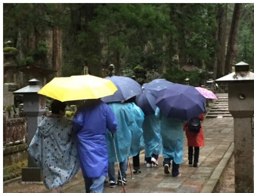
あの世を歩く参加者（2017 年）