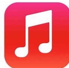
Apple Music のアイコン

Apple Music はジャンルを問わず約 75,000,000 曲が聞き放題です。最初の 1 ヶ月は無料のお試し期間があります。ただし 1 ヶ月をすぎると自動的に 980 円の料金がかかるので、不要の場合は無料期間内に解約が必要です。定期的に入会キャンペーンもあり、現在は無料期間が 3 ヶ月に延長されています。