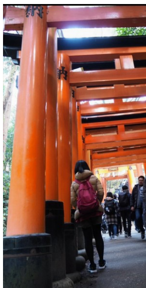
地元伏見稲荷の鳥居をくぐる